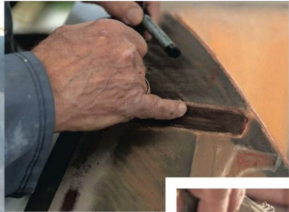
Het vinden van de juiste kleuren is een zoektocht, soms zelfs een worsteling.