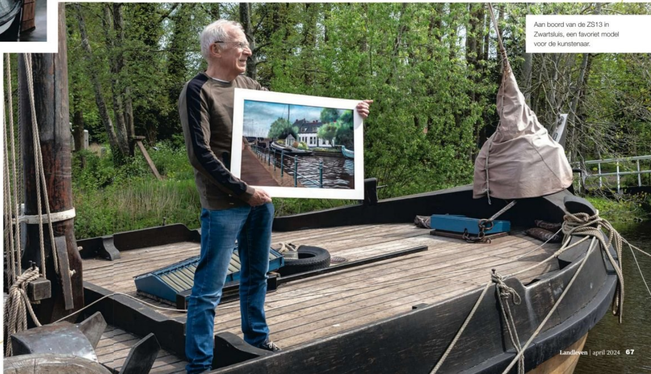
Aan boord van de ZS13 in Zwartsluijs, een favoriet model voor de kunstenaar.