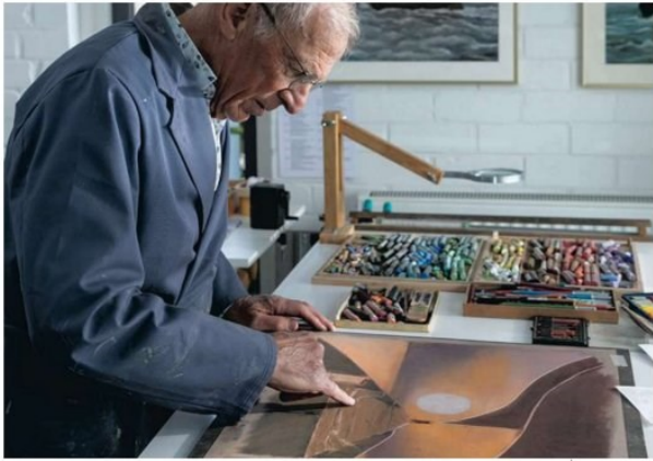
Na het opzetten van de contourlijnen in houtskool begint het inkleuren met pastekrijt.

'Het is de vorm die fascineert, dat ze doorleefd zijn, deuken hebben'